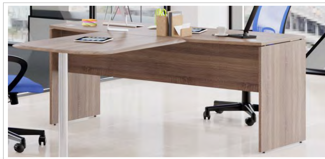
Полноценный кабинет руководителя