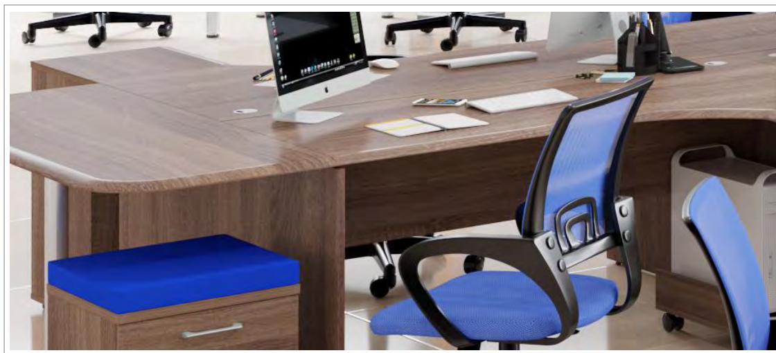
Фронтальные рабочие станции – 2 стола на 1 комплекте опор