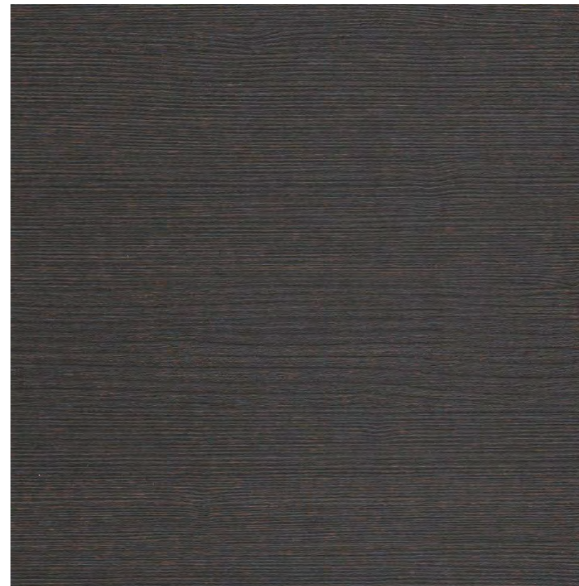
Легно темный (Опоры столов, каркасы шкафов и тумб, дополнительные элементы)