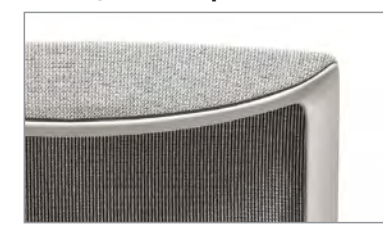
белый пластик + светло-серая сетка