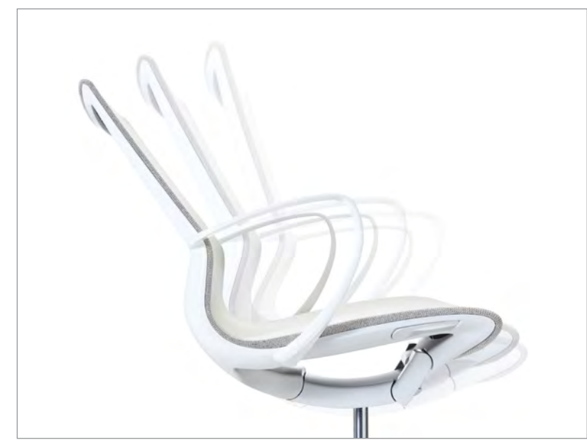
Плавная работа синхро-механизма качания с отклонением спинки на 19° позволяет использовать кресло Marics как для интенсивной работы, так и для расслабления в минуту отдыха

Безупречность — это не когда уже нечего добавить, а когда нечего убрать. Минималистичный внешний вид кресла Marics с полностью интегрированным в структуру кресла синхро-механизмом качания — это чистота линий и визуальная легкость, не нарушаемая ни одной лишней деталью.