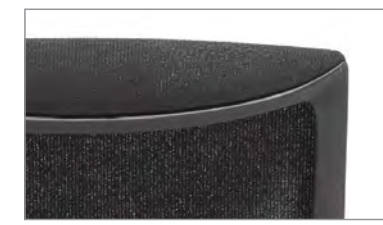
черный пластик + черная сетка