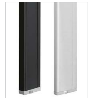
металлические опоры цвета: черный, белый